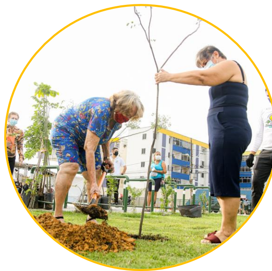
PRAÇAS ou PARQUES