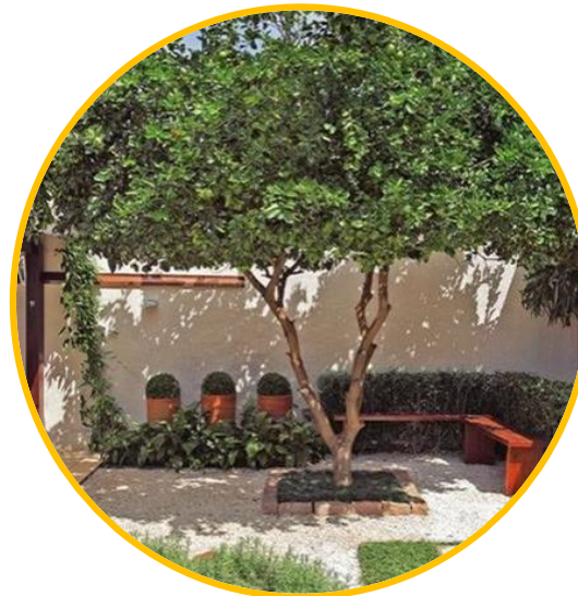
JARDINS ou QUINTAIS