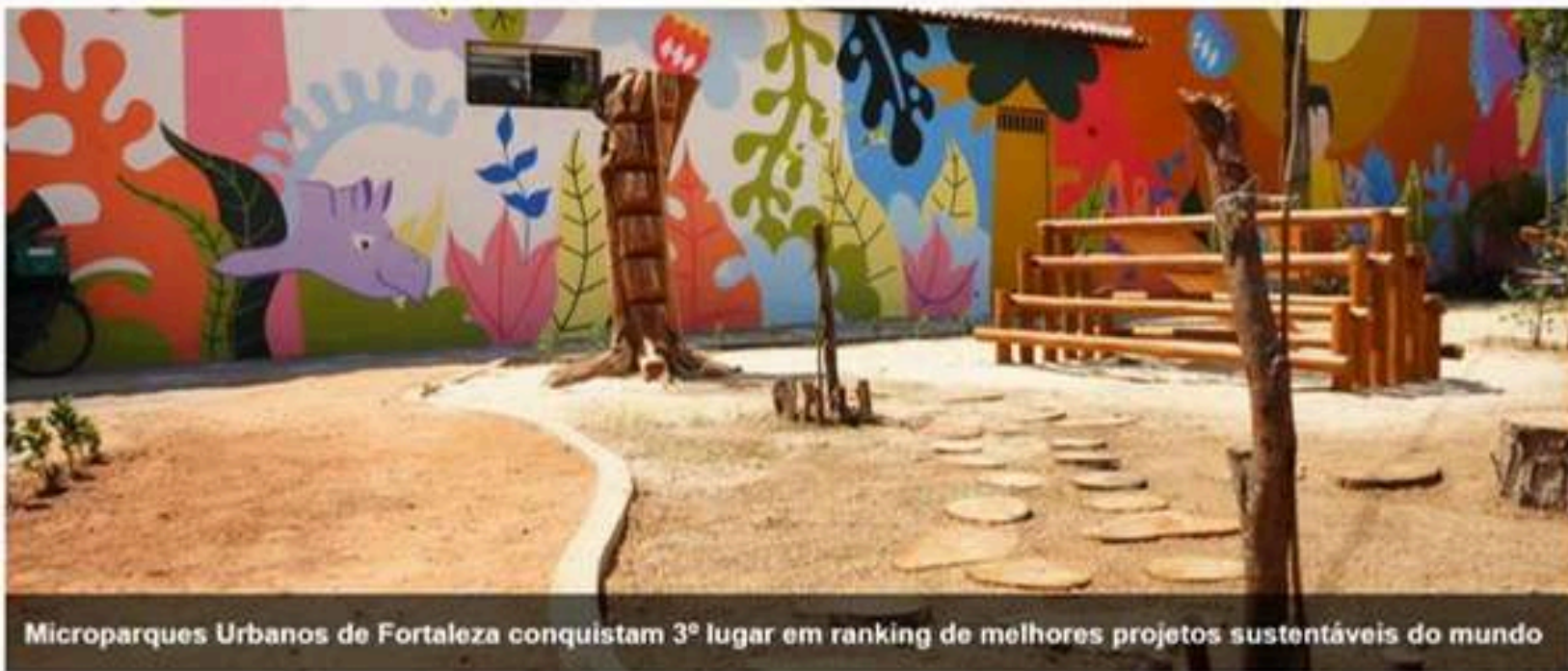
Microparques Urbanos de Fortaleza conquistam 3º lugar em ranking de melhores projetos sustentáveis do mundo