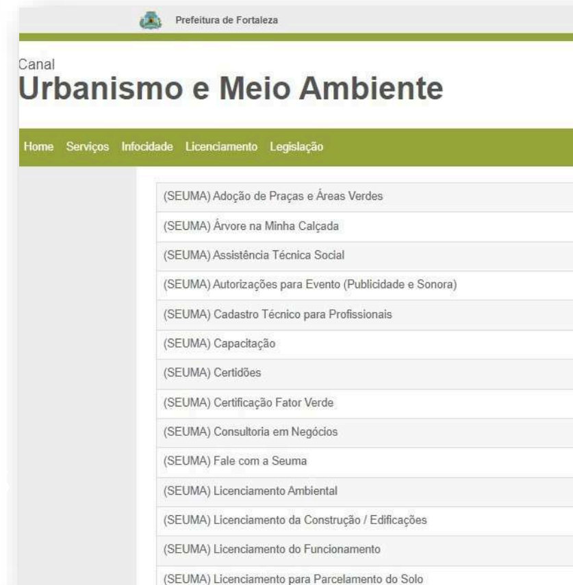
Relação de Serviços no Canal Urbanismo e Meio Ambiente

específica, onde constam as relações de documentos necessários, fluxos, prazos, legislação específica e manuais orientativos referentes a cada serviço.