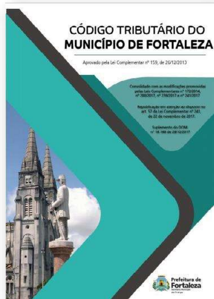
Código Tributário do Município de Fortaleza

Os valores estão definidos no Código Tributário Municipal, Lei Complementar nº 159/2013 (atualizada pela LC nº 241/2017) - ANEXO II - Tabela II .