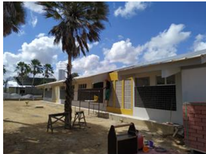
Execução de pintura do bloco educacional