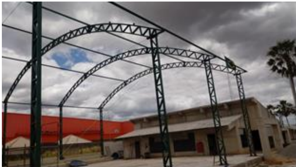
Execução de estrutura metálica da quadra