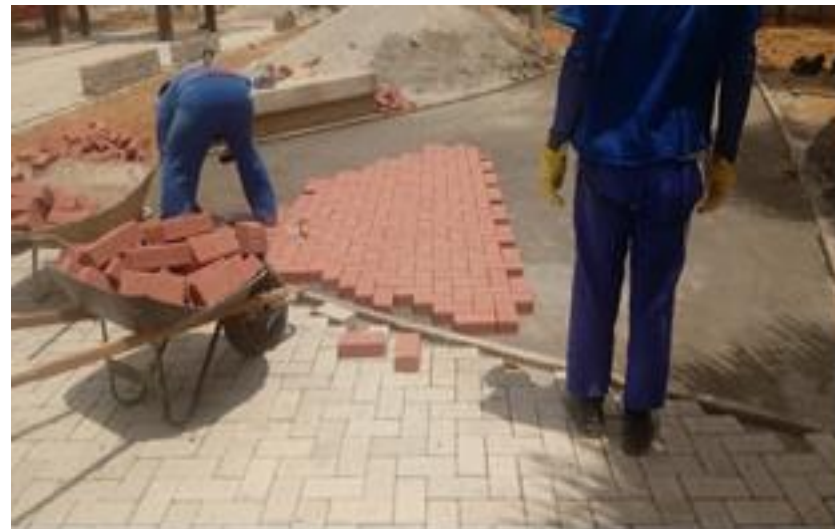
Execução do intertravado da academia