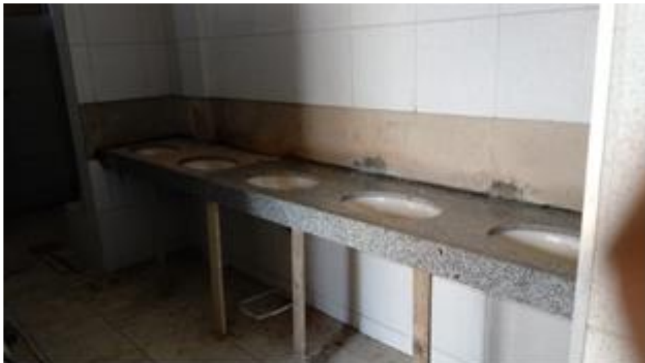
Assentamento de bancadas