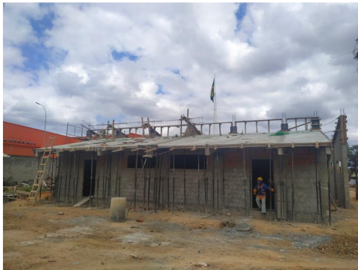
Execução da estrutura da Academia/Dança