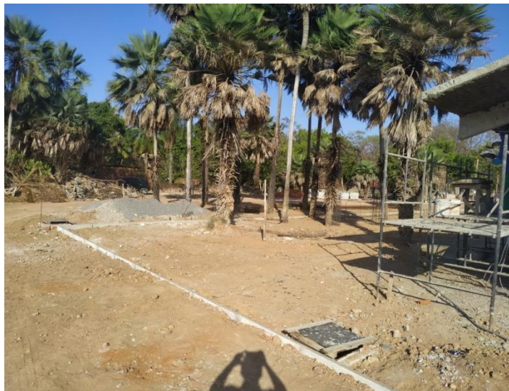
Execução de Guia-Meio Fio