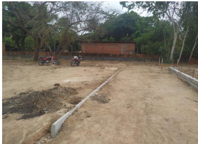
Execução de Guia-Meio Fio