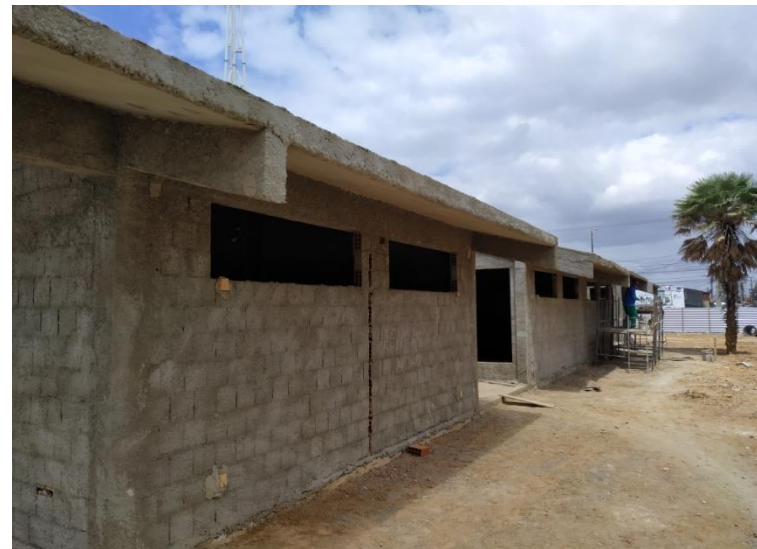
Execução de chapisco no Bloco Educacional