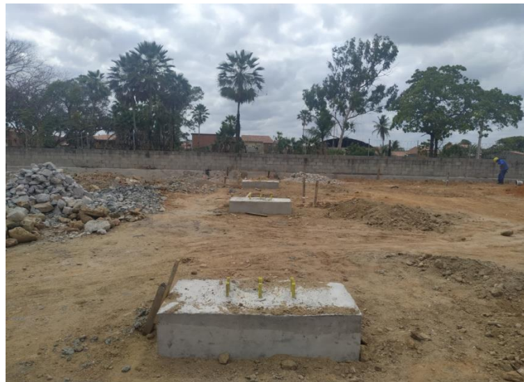
Fundação da Quadra Coberta