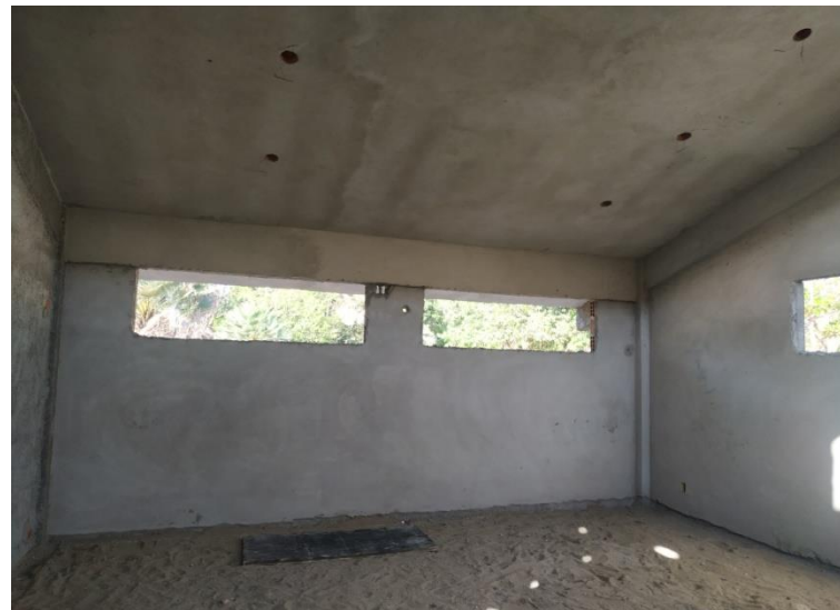
Execução de reboco no Bloco Educacional