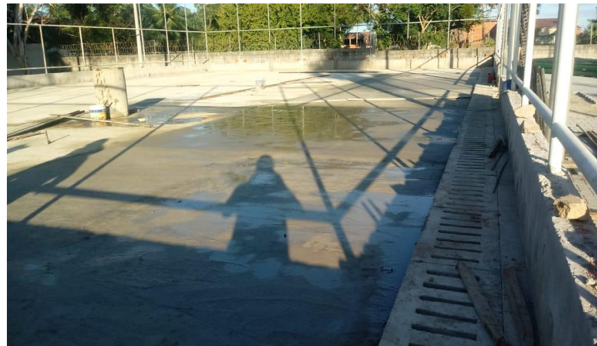
Lastro do campo executado