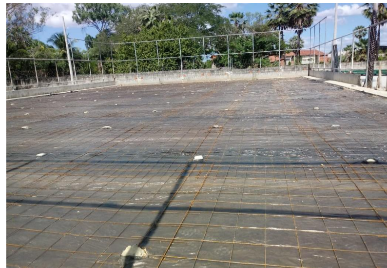
Execução de lastro em concreto para o campo