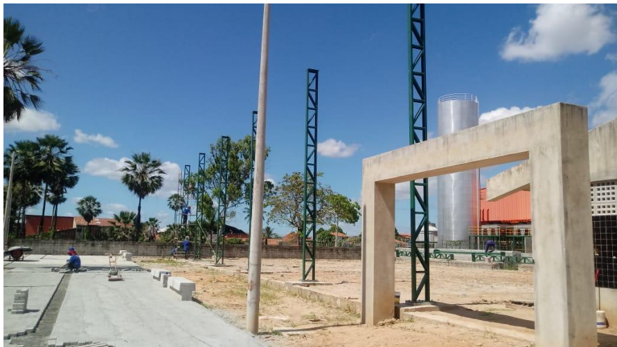
Execução de estrutura metálica da quadra