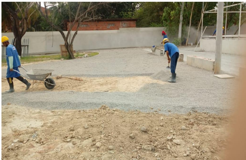
Execução de pedrisco na obra