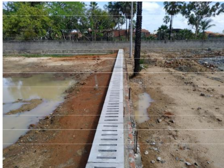
Execução de calha de drenagem no campo