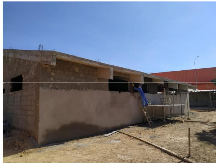
Execução de reboco na Academia/Dança