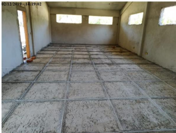
Execução de fitamento do piso no Bloco Educacional