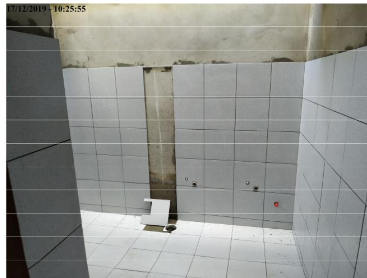
Execução de cerâmica no Bloco educacional