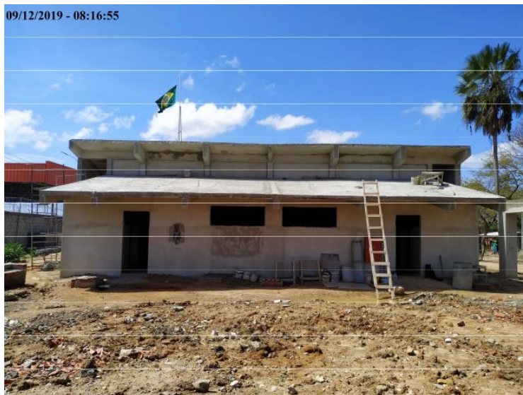
Execução de reboco no Bloco Educacional