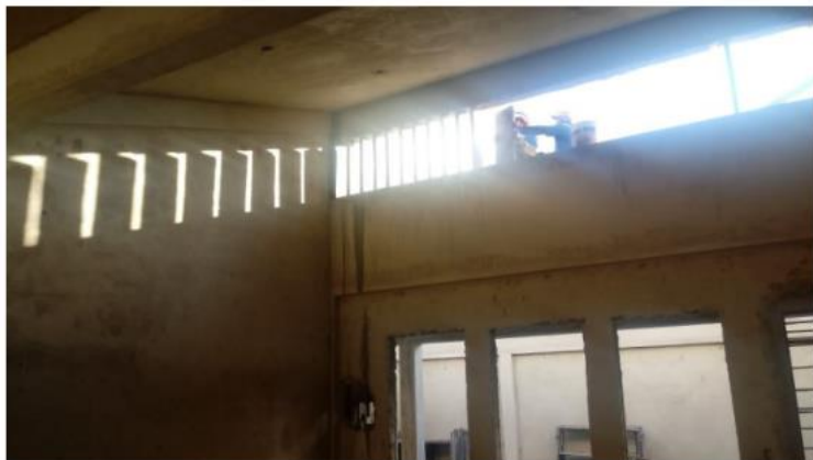
Execução de brise de concreto no Bloco Educacional