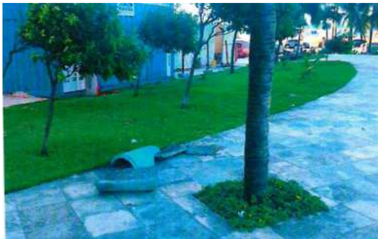
IMAGEM DO RELATÓRIO SEUMA

Já foi efetuada a aquisição de novas lixeiras, tanto para reposição, bem como para aumentar o número delas. Estamos aguardo a entrega pelo fornecedor.