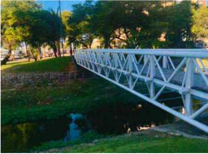
IMAGEM DO RELATÓRIO SEUMA