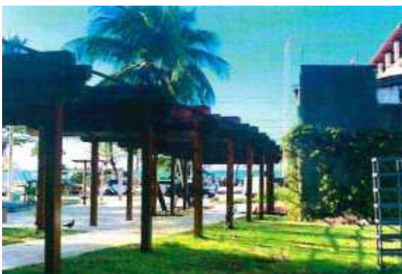
IMAGEM DO RELATÓRIO SEUMA