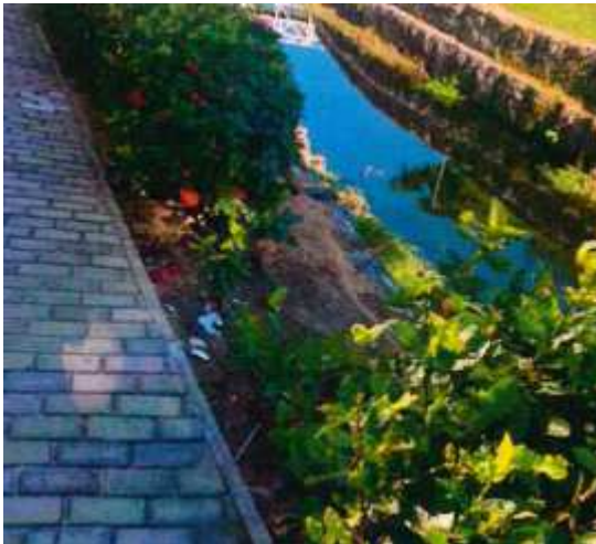
IMAGEM DO RELATÓRIO SEUMA