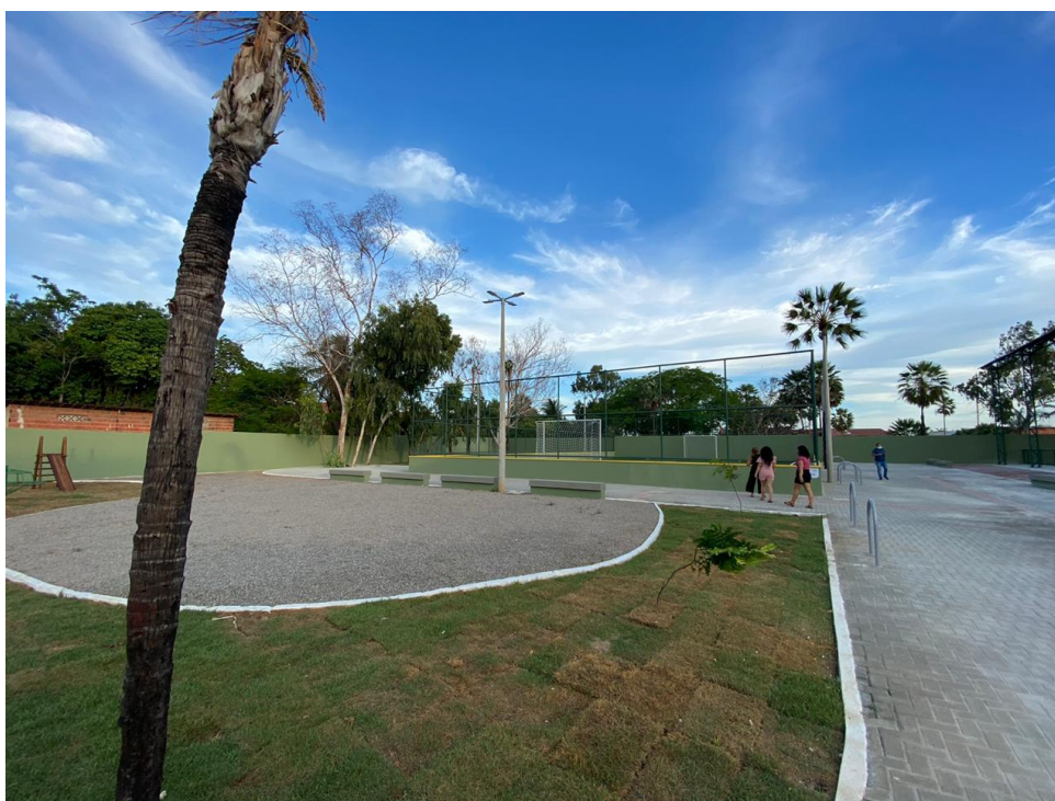
Imagem 05: Vista ampla com campo de futebol ao fundo