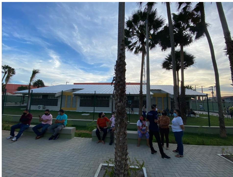
Imagem 02: Vista externa do Bloco Educacional