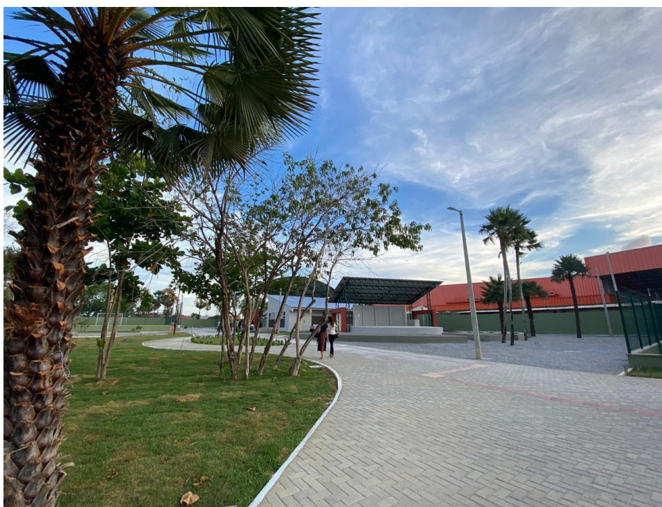
Imagem 03: Vista ampla com o anfiteatro ao fundo