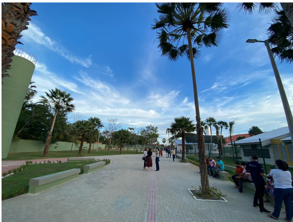
Imagem 01: Boulevard central do Equipamento Cultural

A obra do Equipamento Cultural teve sua Ordem de Serviço assinada no dia 12/03/2019 e foi executada pela Construtora AMP Engenharia EIRELI sob o acompanhamento da Secretaria Municipal de Infraestrutura (SEINF). No dia 07/12/2020, esse equipamento tão importante para a comunidade foi entregue, proporcionando à população um rico espaço de lazer com academia ao ar livre, playground, campo de futebol, quadra poliesportiva, além de um bloco educacional com salas multiuso, sob gestão da Coordenadoria da Juventude, como mostram as imagens 01 a 08.