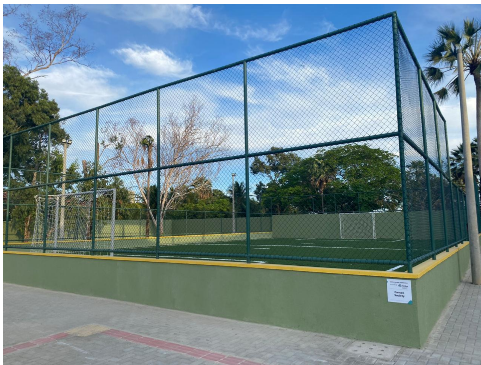
Imagem 06: Campo de futebol