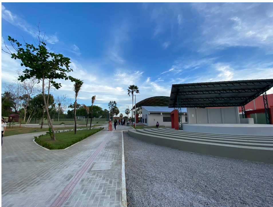
Imagem 04: Vista do anfiteatro