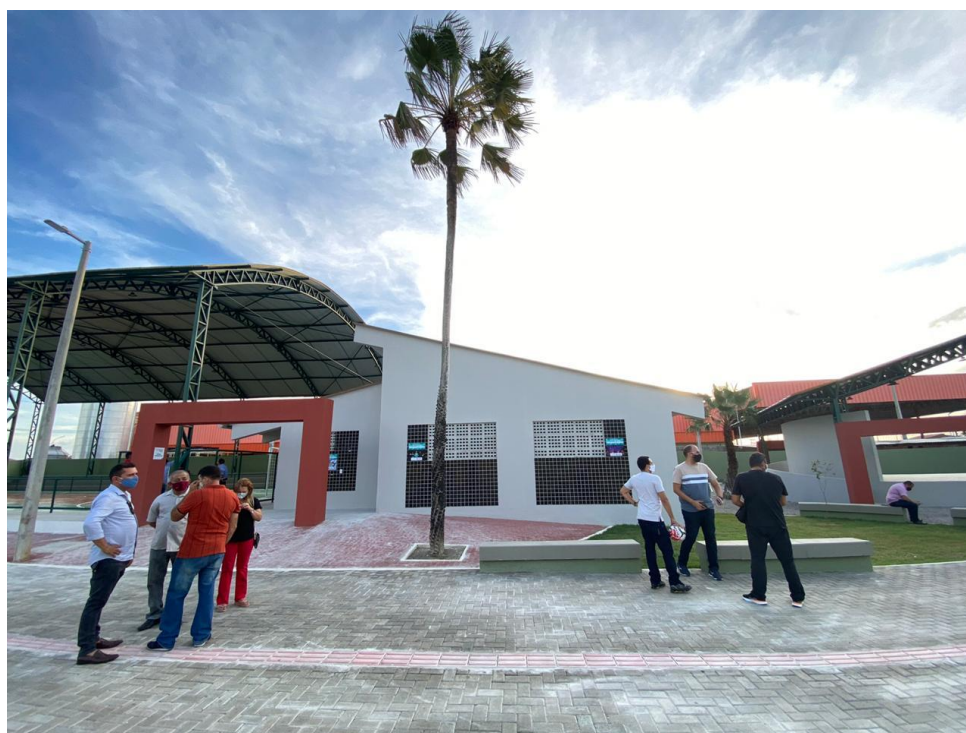
Imagem 08: Vestiários da Quadra poliesportiva