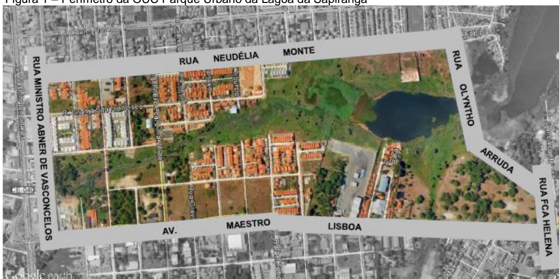
Figura 1 – Perímetro da OUC Parque Urbano da Lagoa da Sapiranga

trecho da ZIA SABIAGUABA, e compõe-se de um conjunto integrado de intervenções urbanísticas e ambientais, visando à implantação de trecho do Parque Urbano da Lagoa da Sapiranga, criado através do Decreto Municipal nº 13.591, de 20 de maio de 2015. A figura 1 apresenta o perímetro dessa OUC, delimitada ao norte pela rua Neudélia Monte, ao leste pelas ruas Olyntho Arruda e Rua Francisca Helena, ao sul pela Avenida Maestro Lisboa, e ao oeste pela Rua Ministro Abner de Vasconcelos.