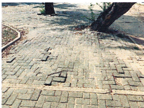
Peças irregulares. Precisa-se de manutenção.