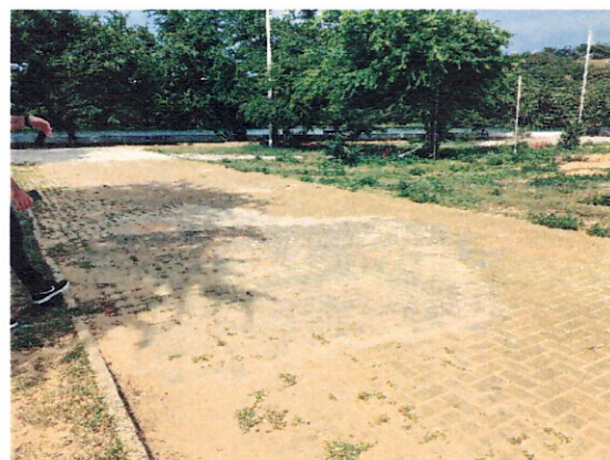
Vegetação entre os blocos. Precisa-se de manutenção.