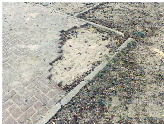
Peças recolocadas, porém com pontos faltando.