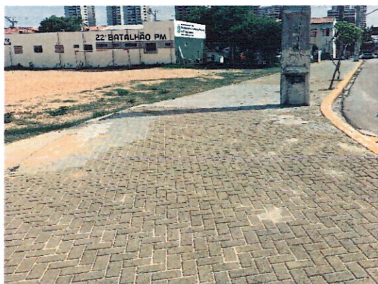
Peças que foram recolocadas.

Houve reparos na pavimentação com a recolocação de bloquetes, porém ainda há pontos com vegetação entre piso e trechos sem pavimentação. É necessário que seja feita a limpeza dos resíduos sólidos, resíduos de poda, a retirada da vegetação e areia entre os blocos, e ainda, a reposição das peças que estão faltando.