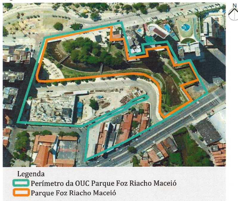
Figura 1 - Localização do Parque Bisão

O Parque Arquiteto Otacílio Teixeira Neto (Bisão), situado na Beira Mar recebeu o nome em homenagem ao arquiteto e urbanista cearense. Foi inaugurado no dia 1º de Agosto de 2014, possui 22.000m 2 (vinte e dois mil metros quadrados), e foi recuperado e revitalizado a partir da Operação Urbana Consorciada (OUC) Parque Foz Riacho Maceió entre o Município, por meio da Secretaria Municipal de Urbanismo e Meio Ambiente (SEUMA), das empresas privada Nordeste Empreendimentos e Participações S/A (NORPAR) a Construtora Colmeia S/A conforme apresentado na figura 1.