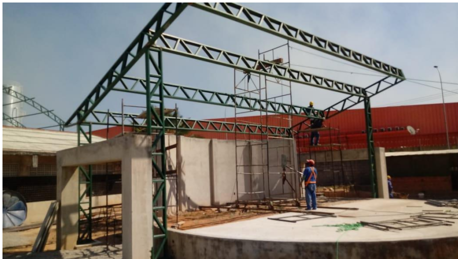
Execução de estrutura metálica do anfiteatro

Relatórios Fotográficos referentes aos meses de agosto e setembro, enviados pela AMP Engenharia.