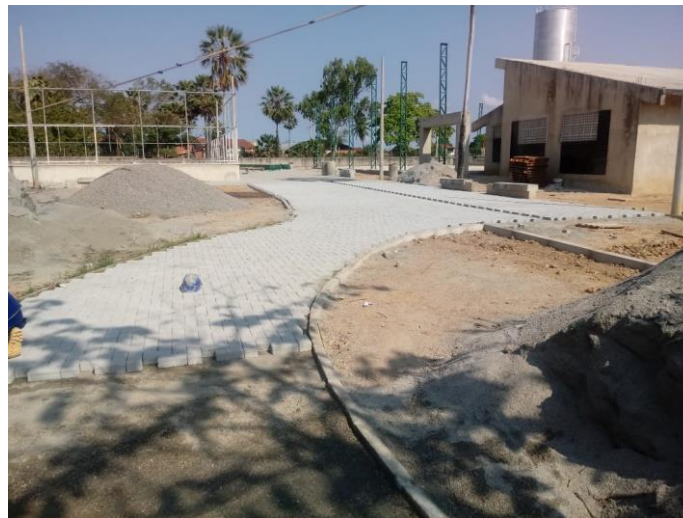
Execução de piso intertravado