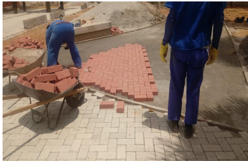
Execução do intertravado da academia