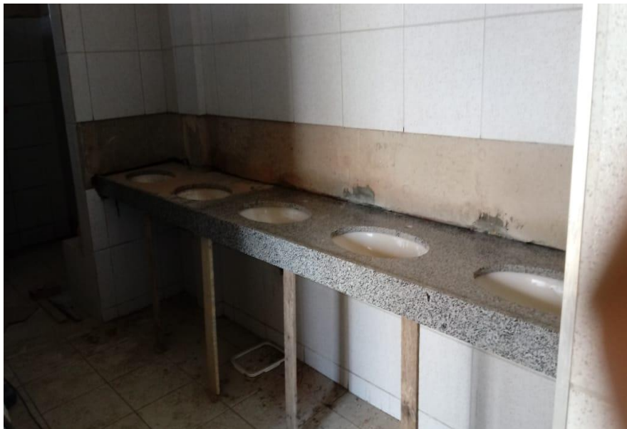
Assentamento de bancadas