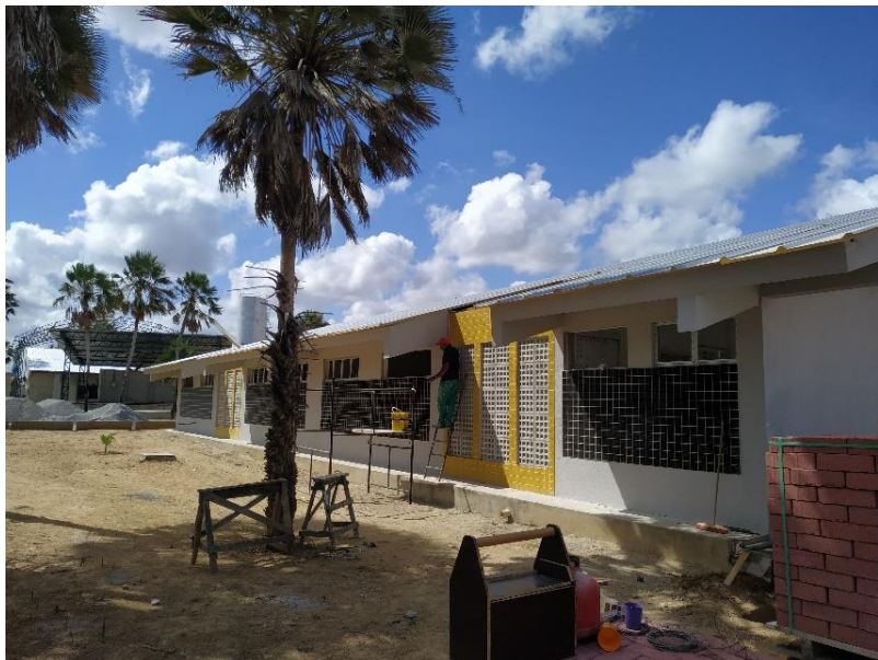
Execução de pintura do bloco educacional