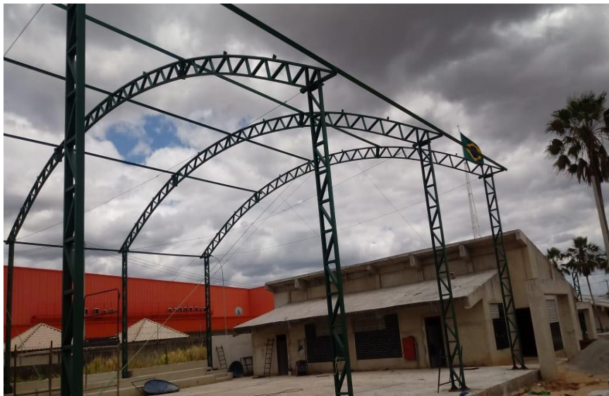
Execução de estrutura metálica da quadra