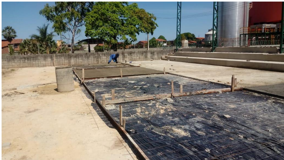
Execução de lastro da quadra coberta