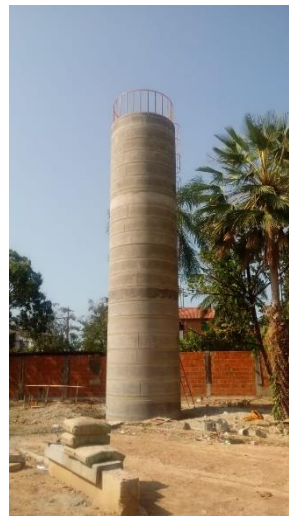
Execução do castelo d'água