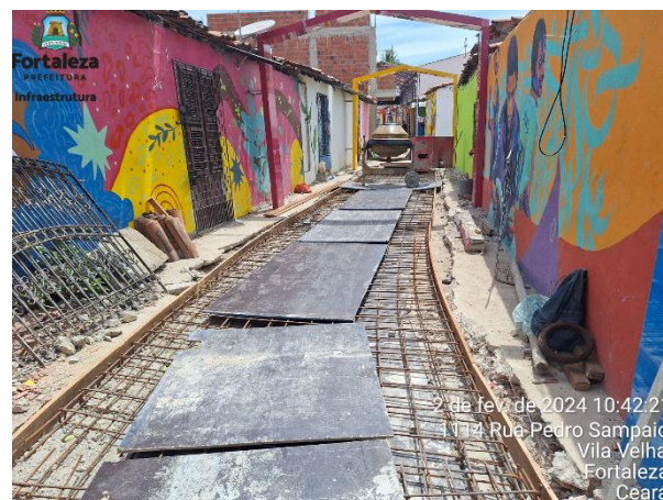
2 de fev. de 2024 10:42:21 1174 Rua Pedro Sampaio Vila Velha Fortaleza Ceará