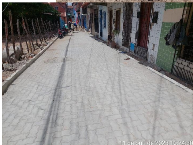
11 de out. de 2023 10:24:30