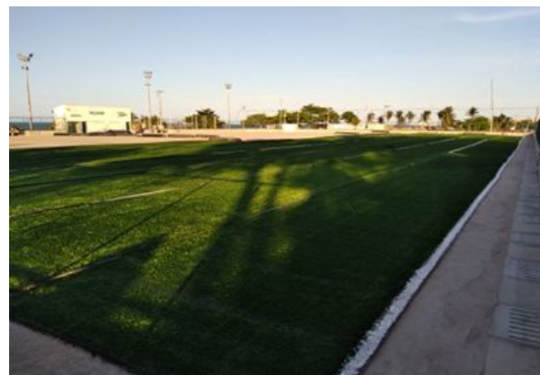
EQUIPAMENTOS DE ESPORTE E LAZER