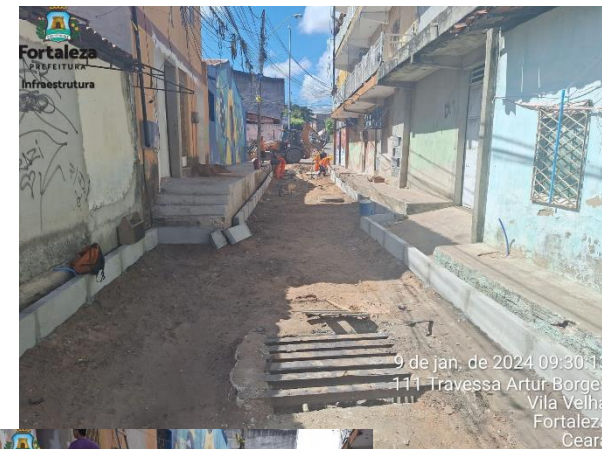
9 de jan. de 2024 09:30:13 111 Travessa Artur Borges Vila Velha Fortaleza Ceará