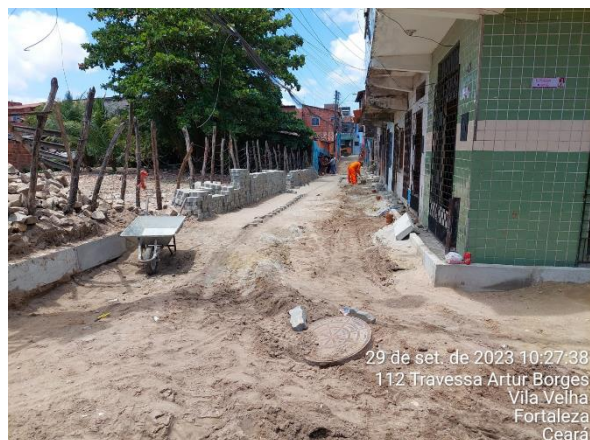
29 de set. de 2023 10:27:38 112 Travessa Artur Borges Vila Velha Fortaleza Ceará