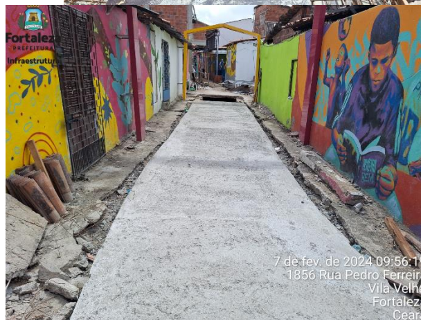
7 de fev. de 2024 09:56:19 1856 Rua Pedro Ferreira Vila Velha Fortaleza Ceará