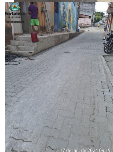
17 de jan. de 2024 09:19:12