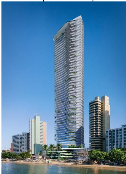
Figura 2 – Perspectiva do Empreendimento

A figura 2 apresenta a perspectiva do empreendimento fornecida pelo requerente.