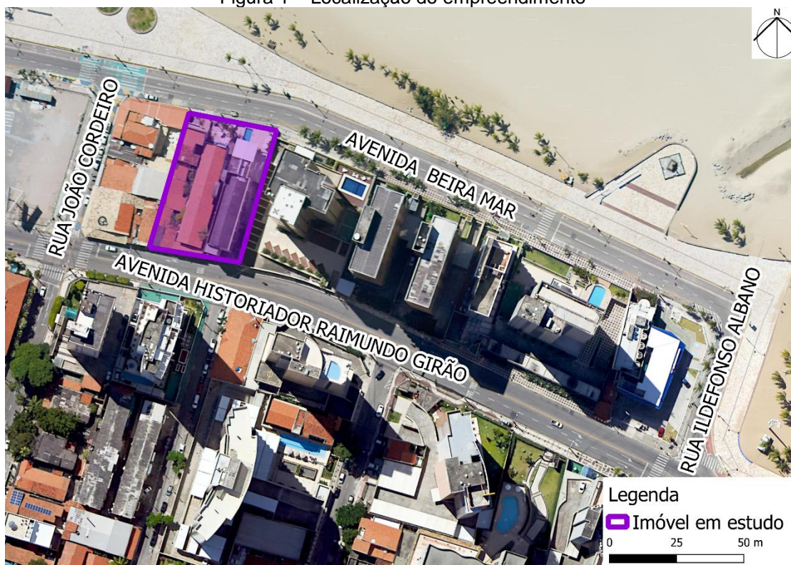
Figura 1 – Localização do empreendimento

Esse processo trata da análise de utilização do instrumento urbanístico Outorga Onerosa de Alteração de Uso do Solo (OOAU) em um empreendimento residencial multifamiliar, prédio de apartamentos, situado à Avenida Beira Mar, nº 990, bairro Meireles, Fortaleza, Ceará. O terreno do empreendimento está localizado no quadrilátero formado pela Avenida Beira Mar ao norte, Rua Ildelfonso Albano ao leste, Avenida Historiador Raimundo Girão ao sul e Rua João Cordeiro ao oeste como mostra a figura 1.