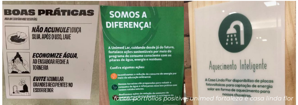
fonte: portfólios positivo, unimed fortaleza e casa linda flor

campanhas e materiais orientativos físicos